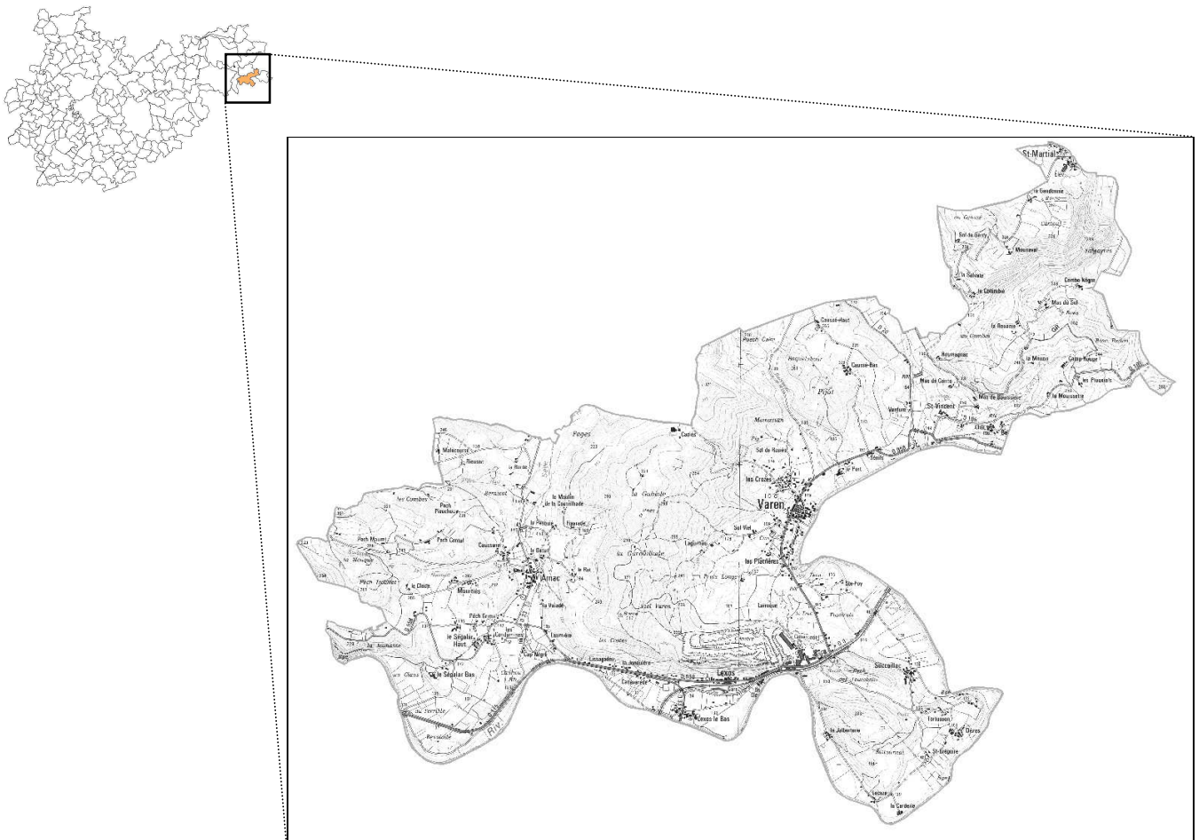
Figure 1 : Situation géographique

La situation géographique de la commune est précisée sur l'extrait de carte suivant.